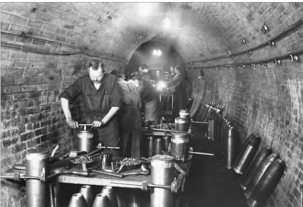
Bild 5 In der Zeit des Ersten Weltkrieges wurden auf dem Gelände der AEG auch Wurfminen produziert. Hierfür wurde jede verfügbare Fläche, auch der schmale Verbindungstunnel, genutzt.

Weder bautechnisch noch elektrotechnisch stellte der AEG-Tunnel somit zur Inbetriebnahme eine Besonderheit dar. Nur die Kombination von gemauertem Tunnel und elektrischer Bahn war neu. In der damaligen Fachpresse von Verkehrs-, Bau- und Elektrotechnik fand er auch kaum Beachtung. Die heutige Bezeichnung als „Versuchstunnel“ in weiten Teilen der Sekundärliteratur ist nicht zutreffend. In den Unterlagen der AEG wurden für den Tunnel Bezeichnungen wie Verbindungstunnel, später Mf-Tunnel oder Tunnel Mf-Zf benutzt, wobei Mf für Motorenfabrik und Zf für Zählerfabrik steht. Wenn der Tunnel neben der Sicherstellung einer leistungsfähigen Verbindung zwischen den Fabrikstandorten eine weitere Funktion für die AEG hatte, dann die eines Demonstrationsobjekts.