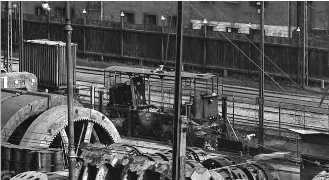
Bild 4 Nachdem der Betrieb durch den Tunnel bereits 1904 eingestellt worden war, stand der Triebwagen am 23. Mai 1906 ausgeschlachtet auf dem Werksgelände.